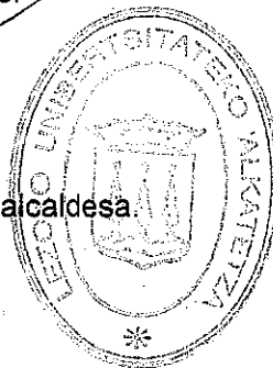
Ainhoa Zabalo Loyarte, alcaldesa.