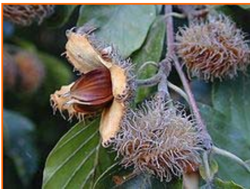
Pagatxa ( pagoa )