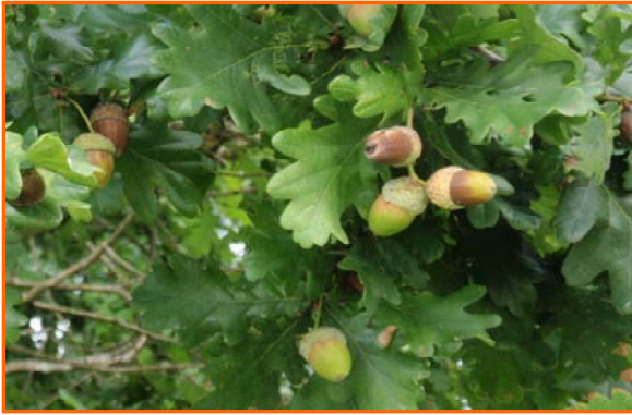
Ezkurra ( haritza )