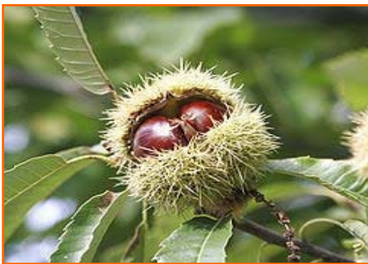
Gaztaina ( gaztainondoa )