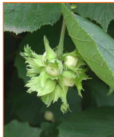
Hurra ( hurritza )