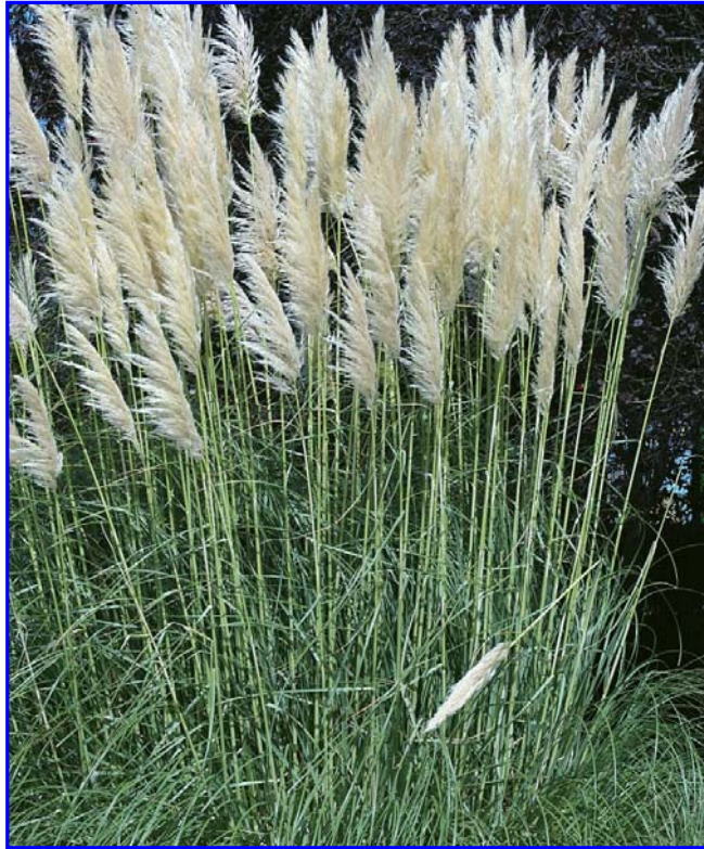
Cortaderia selloana (Panpa-lezka)